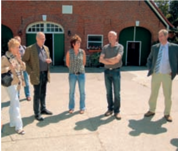
Die EU informierte sich im benachteiligten Gebiet im Landkreis Wesermarsch.

In der zweiten Stufe der Gebietsabgrenzung sollen die Gemeinden wieder aus der Gebietskulisse herausgenommen werden, die aufgrund von technischen Maßnahmen (z.B. Entwässerung, Bewässerung) oder auf der Basis von Wirkungsindikatoren (Ernteerträge, GV-Besatz, Standarddeckungsbeitrag)